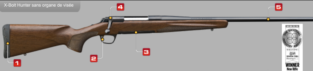
X-Bolt Hunter sans organe de visée

La nouvelle Browning X-Bolt apparaît comme une révolution dans l'univers des carabines à verrou. La X-Bolt a été conçue sur la base du succès des carabines Browning précédentes, tout en apportant de nombreuses innovations qui en font sans aucun doute une des meilleures carabines du marché.