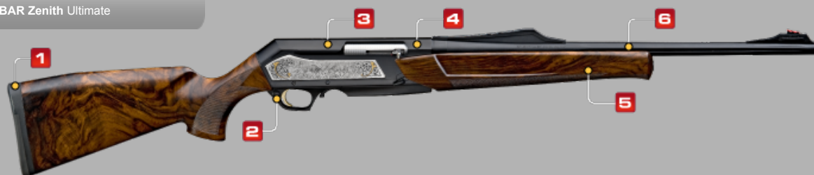
BAR Zenith Ultimate

Leader incontrastato con un'esperienza di 46 anni, Browning è lo specialista nel campo delle carabine semiautomatiche. Questo titolo lo deve alla qualità del suo meccanismo, alla dolcezza del suo funzionamento con un sistema a presa di gas che riduce al massimo la sensazione di rinculo, alla sua affidabilità ma anche e soprattutto al fatto che si è costantemente evoluta per offrirvi delle prestazioni sempre più elevate.