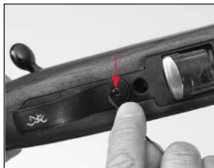
Réglez la détente à l'aide d'une clé hexagonale de 1/16".