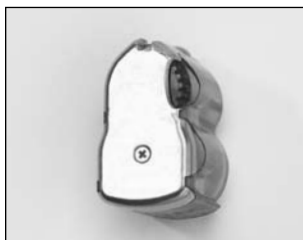
Le chargeur à double hélice MC à dix coups (vue arrière)