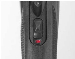
La « sûreté » montrée en position « non sécuritaire ».