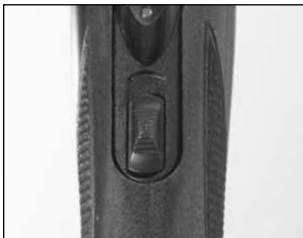
La « sûreté » montrée en position « sécuritaire ».